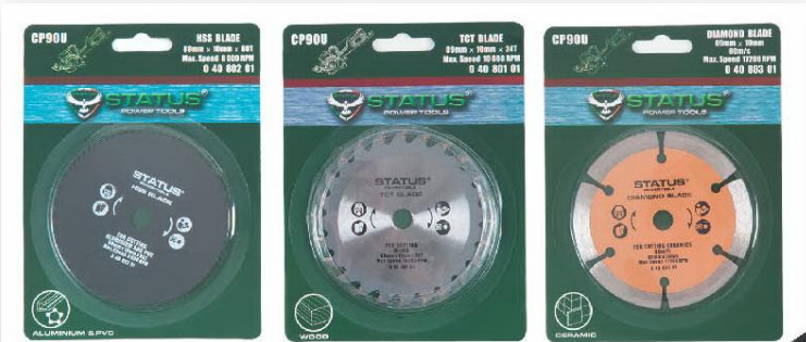
Комплект из 3-х пильных дисков.