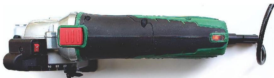
▲ Индикатором питания, чтобы вы всегда знали, когда инструмент активен.