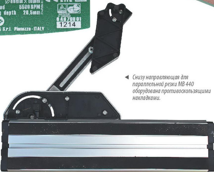
◀ Снизу направляющая для параллельной резки MB 440 оборудована противоскользящими накладками.

Многофункциональная пила STATUS CP90U в комплекте с направляющей MB 440, идеально подходит для резки самых разнообразных материалов: вам потребуется всего лишь один инструмент, чтобы резать разнообразные материалы. От дерева, плитки и ламинированных полов до алюминия и ПВХ. Эта пила способна делать точные разрезы по прямой линии, угловые распилы, а так же очень удобна для врезного пропила. За отдельную плату производитель комплектует свою новинку направляющей для параллельной резки, которая практически превращает CP90U в миниатюрную торцовочную пилу, значительно упрощает работу и существенно повышает точность. Больше всего направляющие подходят для работы с паркетом, ламинатом, или керамической плиткой, а также другими отделочными материалами, небольшого размера. STATUS CP90U может работать с различными дисками, такими как алмазные диски, лезвия из быстрорежущей стали и твердого сплава.