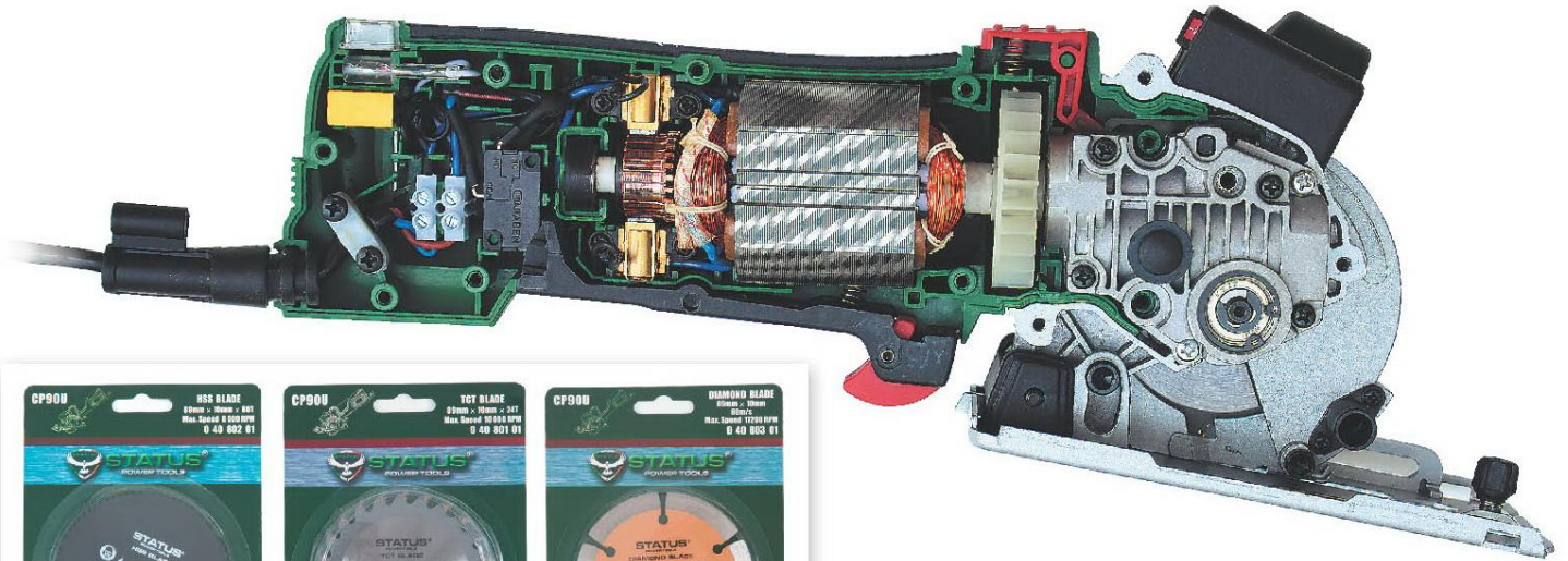
▲ Алюминиевый корпус редуктора и кнопка блокировки шпинделя для удобной замены дисков.